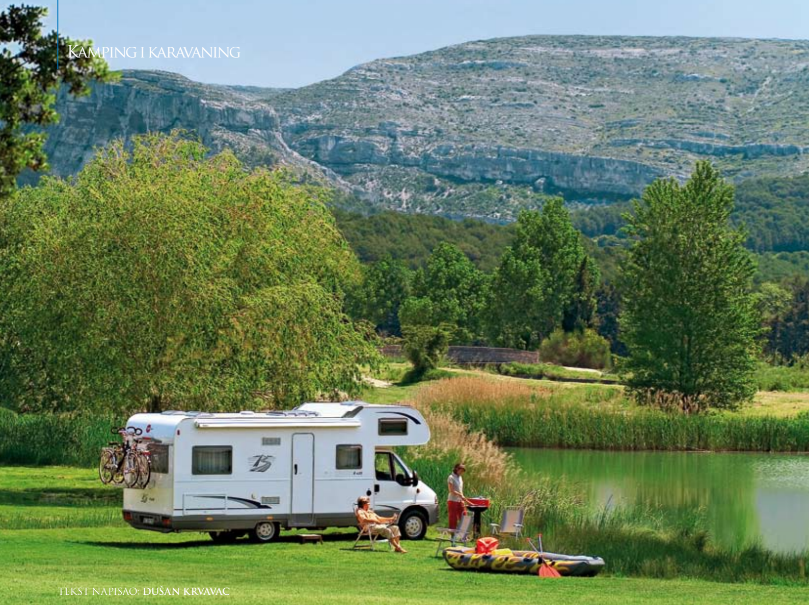
TEKST NAPISAO: DUŠAN KRVAČAV